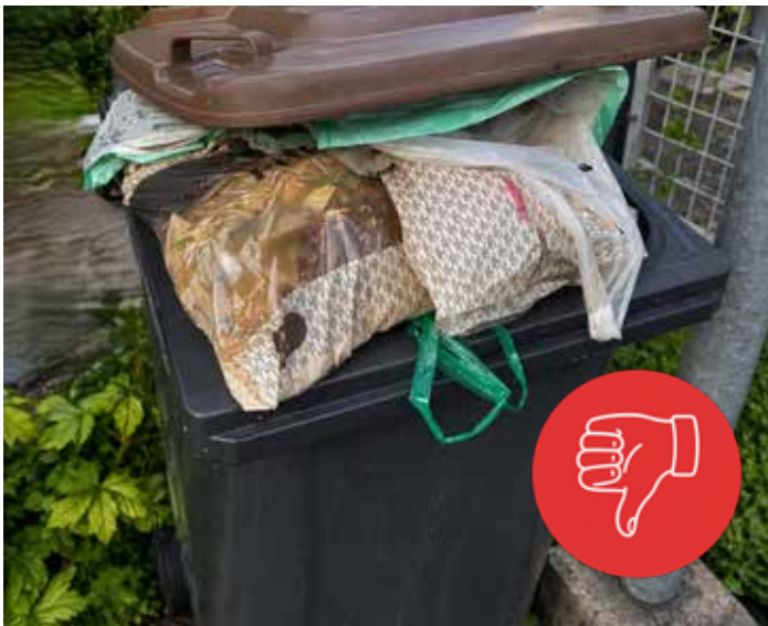
Überfüllte und flasch befüllte Behälter erschweren oder verhindern, dass das Entsorgungspersonal die Tonnen ordnungsgemäß entleeren kann.

Falsche Mülltrennung, zusätzlicher Abfall neben der Tonne oder völlig überfüllte Mülltonnen verursachen täglich einen zusätzlichen Aufwand für das Personal und Kosten für die Allgemeinheit. Oft ist eine Entleerung der Behälter gar nicht mehr möglich. Das wiederum sorgt für Unverständnis und verärgerte Anrufe, obwohl die Schuld nicht beim Entsorger liegt. Als Lösung werden in Zukunft bei der Entleerungsfahrt Anhänger als Feedback an den Mülltonnen hinterlassen, um klare und verständliche Rückmeldung für die Bürgerinnen und Bürger zu gewährleisten.