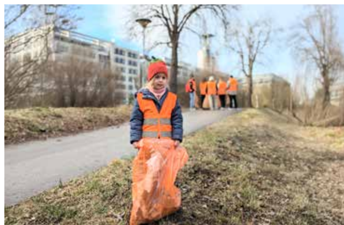
Auch für Kinder sind die Flurreinigungen eine gute Möglichkeit, um einen achtlosen Umgang mit unserer Umwelt zu lernen.