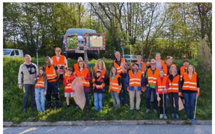
Frühjahrsputzaktion der Gemeinde Hofamt Priel