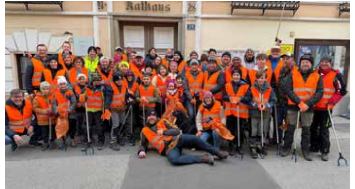
Frühjahrsputzaktion der Marktgemeinde Marbach an der Donau

Wir bedanken uns bei allen Organisatoren und Teilnehmern für das tolle Engagement!