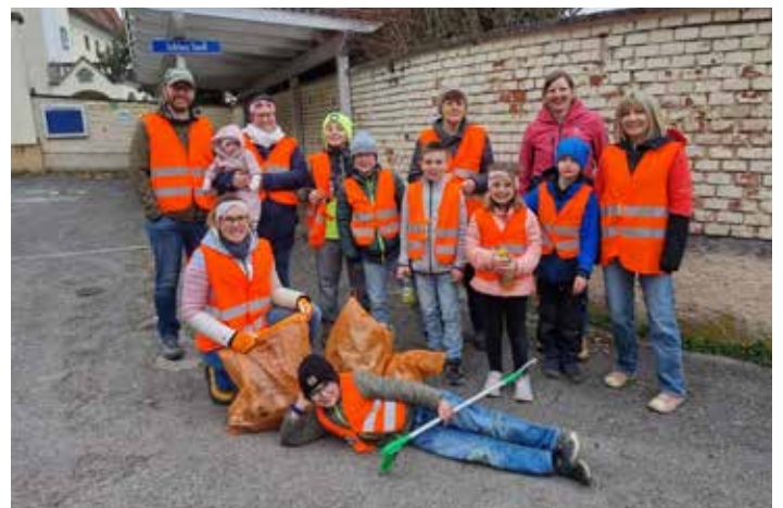
Frühjahrsputzaktion der Marktgemeinde Hürm